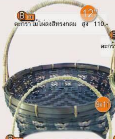
B 01 ตะกร้าไม้ไผ่ลงสีทรงกลม สูง 12" 110.-