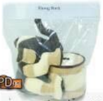
PD12 กล้องกระดาษชำระรูปช้าง 145.-