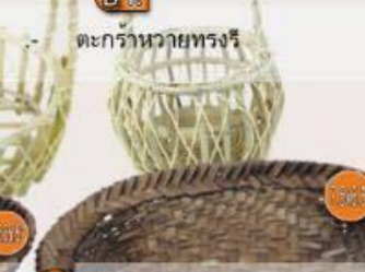
B 08 ตะกร้าหวายทรงรี 4" 40.-