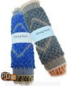
PD09 พรมเช็ดเท้า(ขนาดกลาง) 120.-