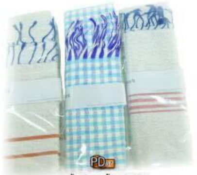
PD08 ผ้าสีตะกร้อ 240.- (ทอไทย-พิมพ์)