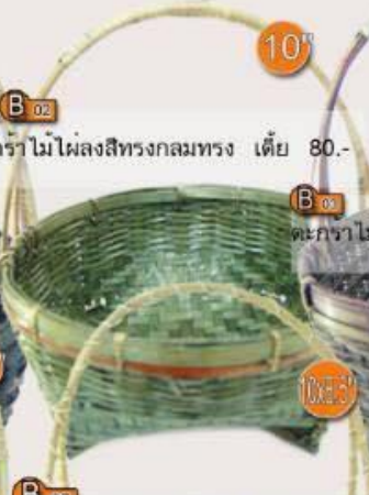
B 02 ตะกร้าไม้ไผ่ลงสีทรงกลมทรง เตี้ย 10" 80.-