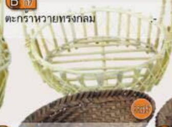
B 07 ตะกร้าหวายทรงกลม 10x8" 120.-