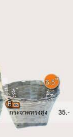
B 05 กระจาดทรงสูง 6.5" 35.-