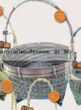
B 03 ตะกร้าไม้ไผ่ลงสีทรงกลม สูง 10" 90.-