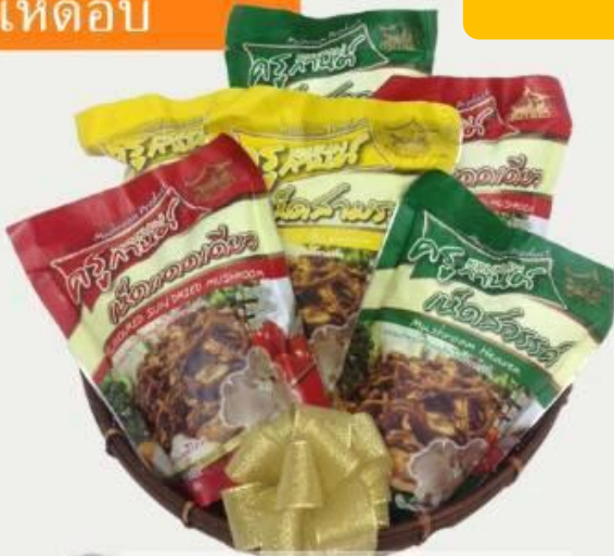
PF01 เห็ดอบ ครุกานต์ 25.- (สามรส/แตงเขียว/สวรส) 10กรัณ