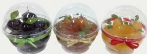
PF11 วันผลไม้ 35.- (รสพิททูล/เสาวรส/มะตูม)