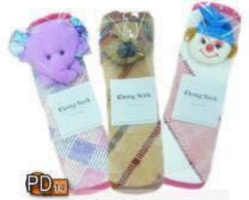
PD14 ปกจับตุ๋นเย็น 25.-