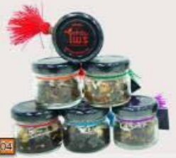
PD04 ยาตมสมุนไพร 55.- (สำหรับโพ / วาโรเซล / เดโรเซล / ตาโรเซล)