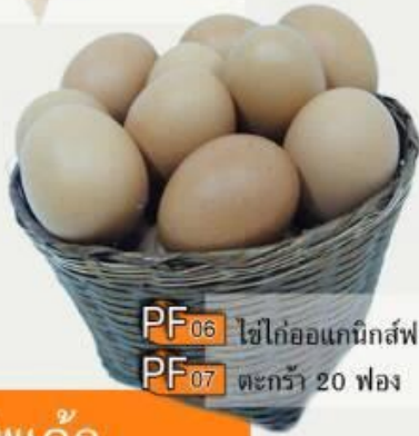
PF06 ไข่ไก่ออแกนิกส์ฟองละ 6.-