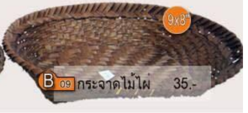
B 09 กระจาดไม้ไผ่ 9x8" 35.-