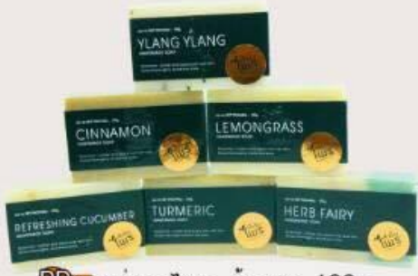
PD01 สบู่สมุนไพร ก้อนละ 120.- (Refreshingcucumber/ Ylang Ylang/Herb fairy/ Lemon glass/Cinamon)