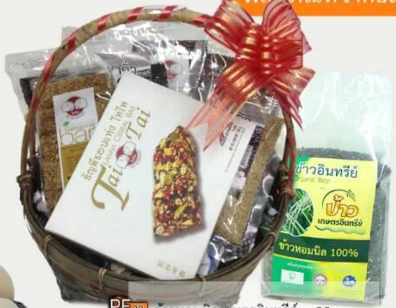
PF02 ข้าวหอมนิลเกษตรอินทรีย์ 80.- ข้าวหอมนิลเกษตรอินทรีย์(บรรจุถุง 2 กก.)