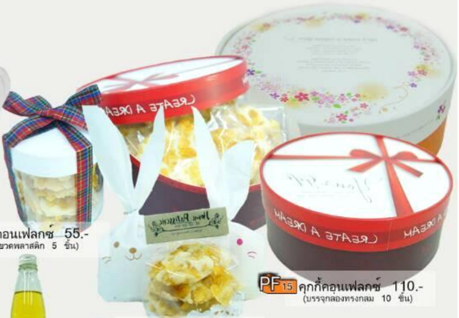
PF15 คุกกี้คอนเฟลกซ์ 110.- (บรรจุกล่องทรงกลม 10 ชั้น)