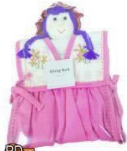
PD10 ผ้าเช็ดมือ 120.-