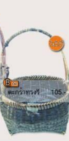
B 04 ตะกร้าทรงรี 7x9" 105.-