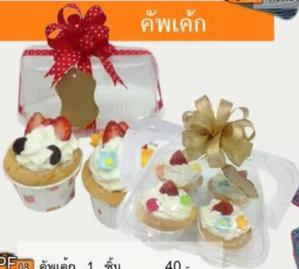
PF08 คัพเค้ก 1 ชั้น 40.- (ใส่ถุงพลาสติกผูกโบว์)