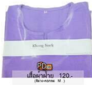
PD07 เสื้อผ้าฝ้าย 120.- (สีม่วง-ทอง M.)