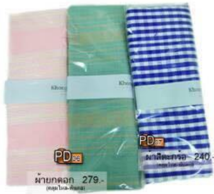
PD06 ผ้ายัดดอก 279.- (ขนาด 10x10 นิ้ว)