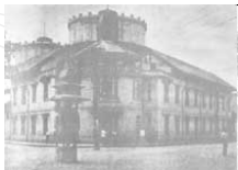
โรงเรียนวัดมเหยงคณ์พาราม