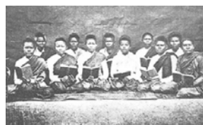
โรงเรียนสอนภาษาอังกฤษในวัง